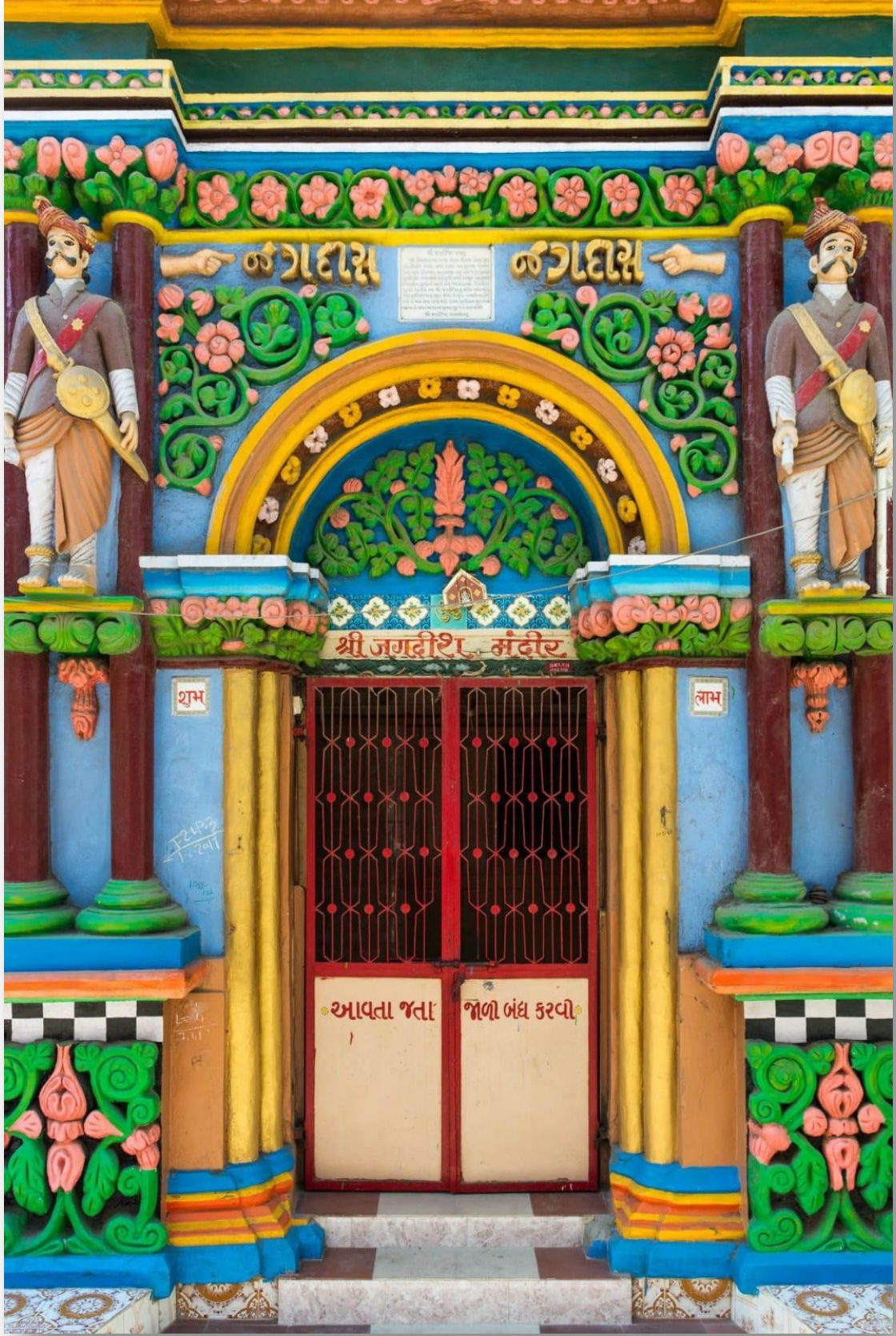
આ તસવીરમાં મંદિરનું પ્રવેશદ્વાર ફૂલો અને પાંદડાંની શિલ્પકળા કારીગરીથી સુશોભિત કરેલ જોવા મળે છે.