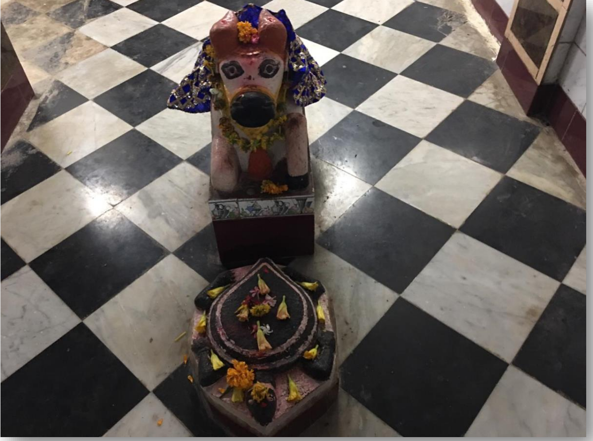
શિવલિંગની સામે કાયબો તેમજ પોઠિયો બિરાજમાન જોવા મળે છે.