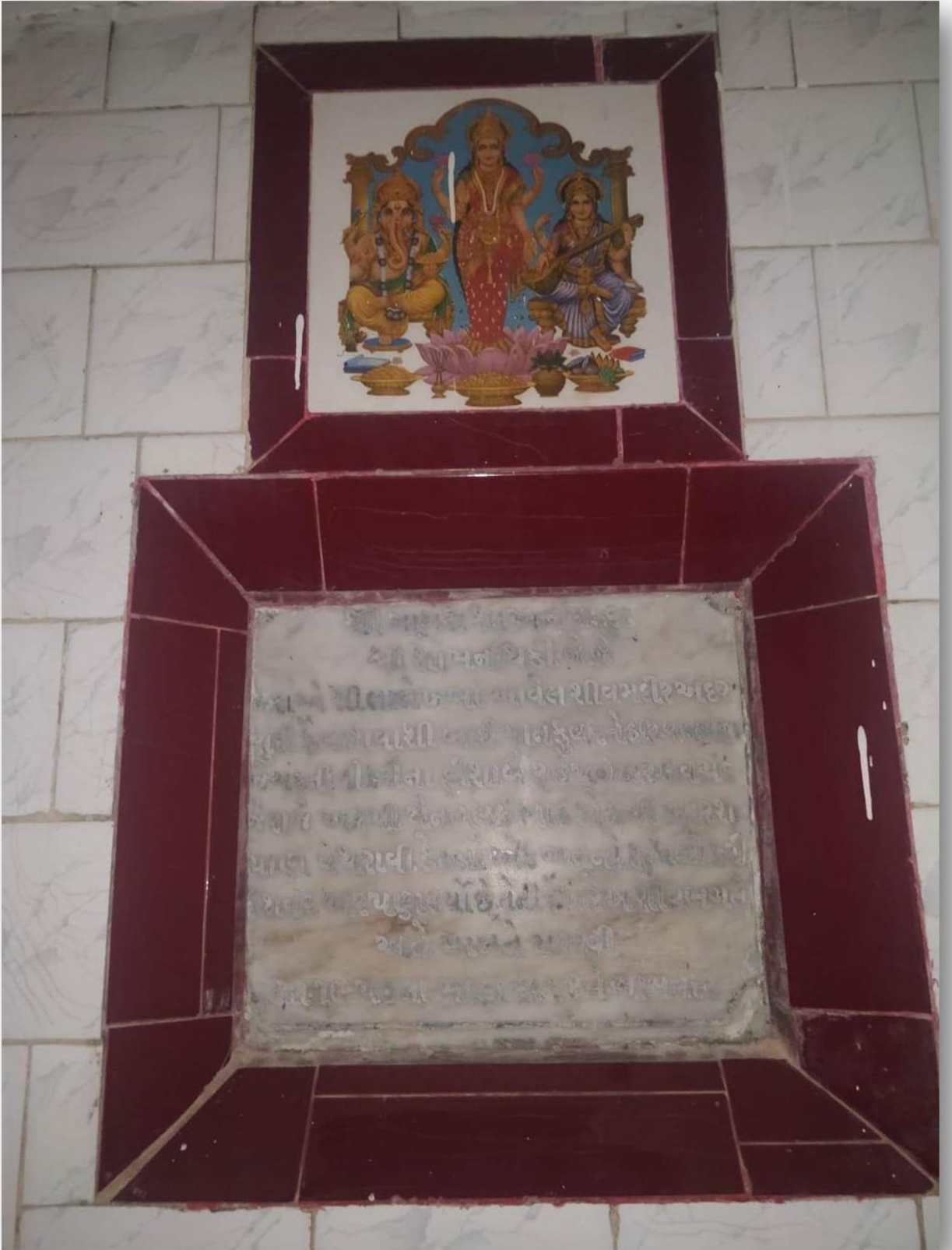
આ સોમનાથ મંદિરના થયેલ જીર્ણોદ્ધાર માટે અર્પણ કરાયેલી રાશિ, તેના દાતા અને સમય વિષેની માહિતી આ તપ્તીમાં અંકિત જોવા મળે છે.