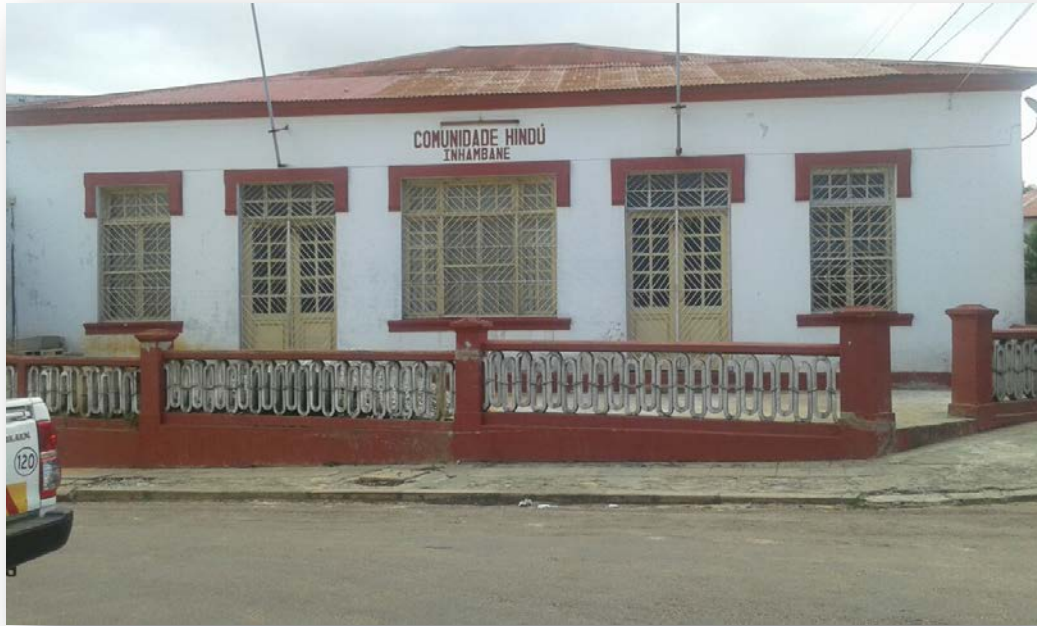
O edifício do Hindu Sarvajanique Sabha em Inhambane.