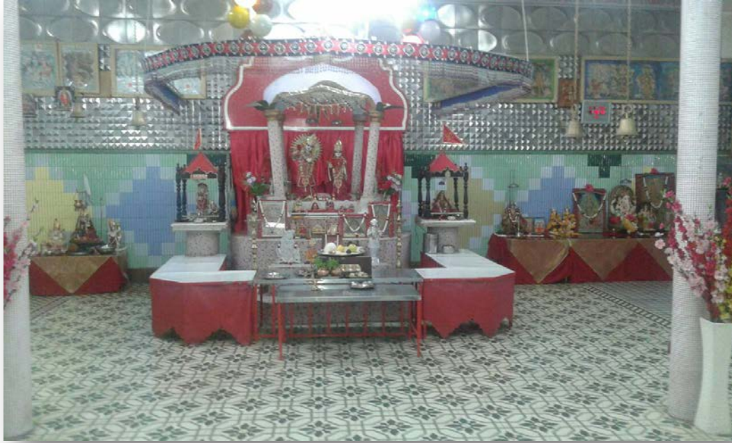
O templo de Shree Radha Krishna na cidade de Inhambane. Foto, cortesia de Sr. Minesh Bhadrassene.