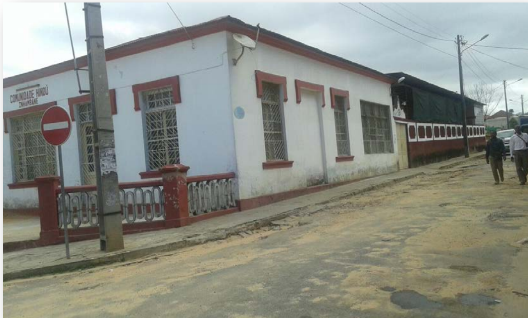
A entrada principal do Sarvajanique Sabha que leva ao templo e ao pátio na parte de trás do edifício.