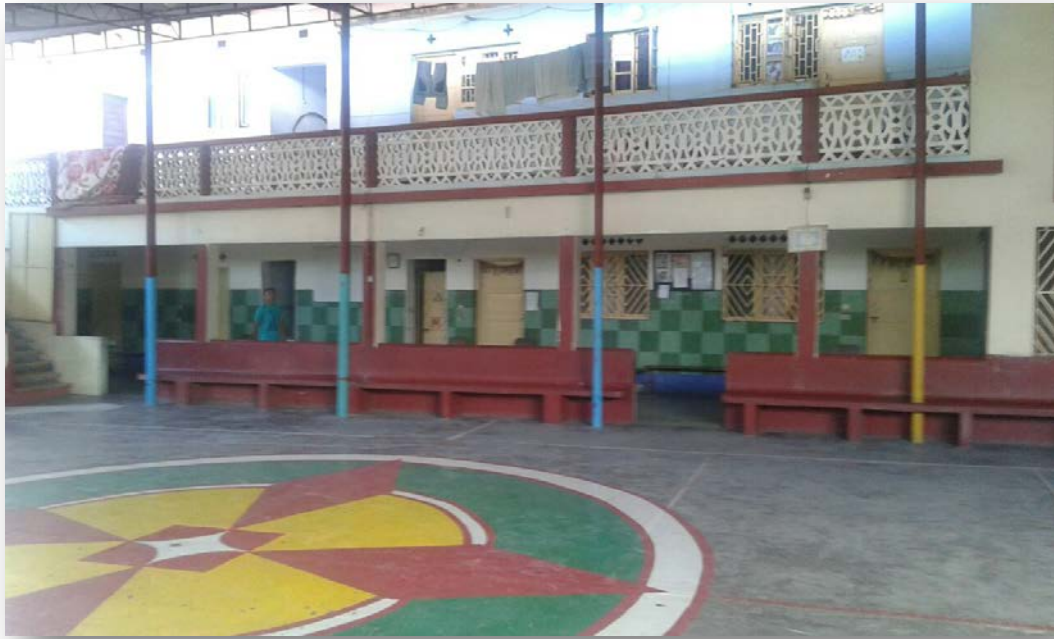
As facilidades de alojamento do templo de Shree Radha Krishna e o pátio.