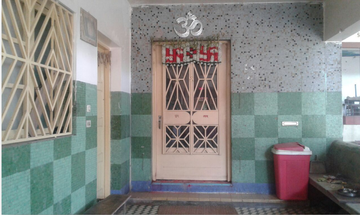
A entrada para o templo de Shree Radha Krishna.