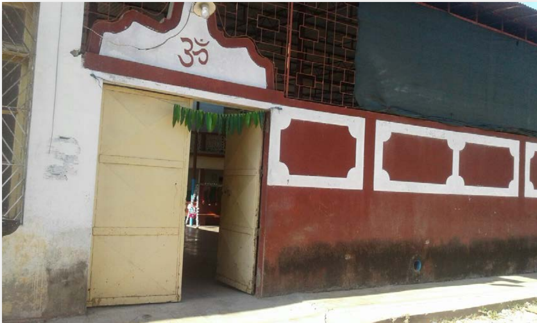
A entrada no lado Oeste do Hindu Sarvajanique Sabha.