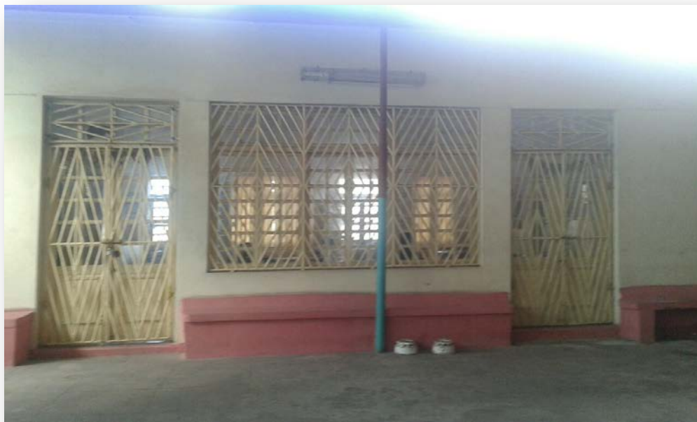
A sala principal vista do pátio.