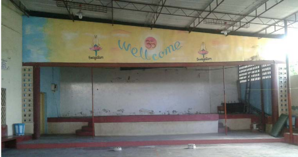
O palco do Sarvajani Sabha onde se realizam as actuações culturais para o entretenimento dos membros da comunidade.