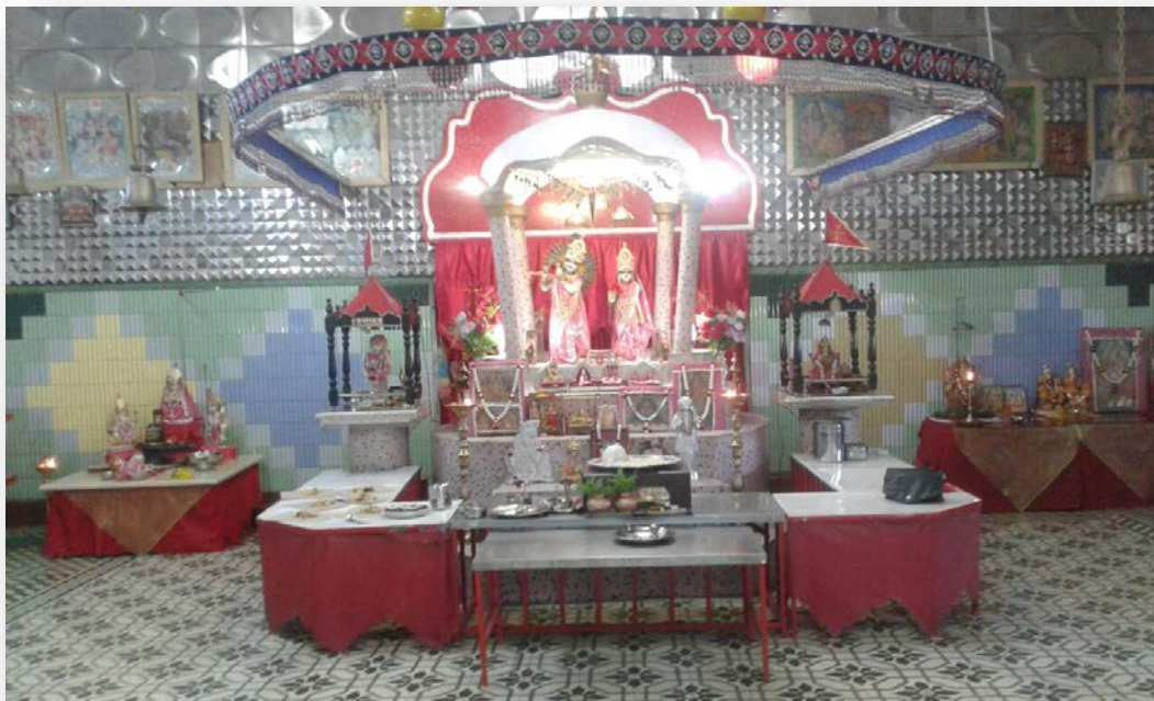
As belas e vibrantes estátuas de Radha e Krishna que foram trazidas da pátria pelo Sr. Vitoldás Aracchande e dispostas no templo.

Actualmente, aos Sábados, as senhoras juntam-se para recitar hinos religiosos e também oferecer orações ao Bajrangbali Hanuman. A recitação de Vedmata Gayatri é feita todos os Domingos entre