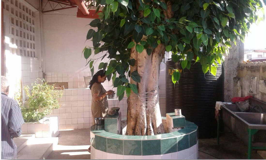
A árvore peepul que se encontra a Leste, no Sarvajanique Sabha, representa a nossa cultura e tradição.