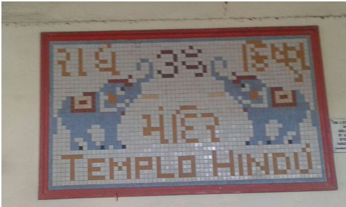
A bela placa ornamental, colocada na parede do templo de Radha Krishna depois da sua renovação.